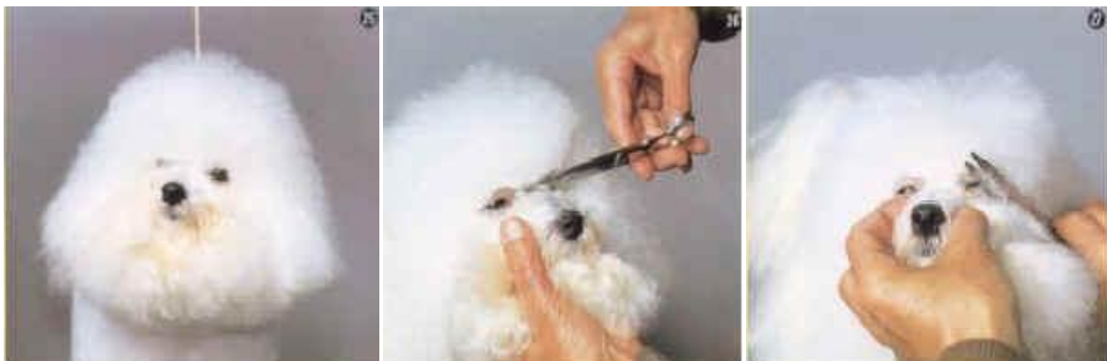
Så kommer hovedet. Klip pelsen væk mellem øjnene. Klip rundt om øjnene, så ingen pels generer.