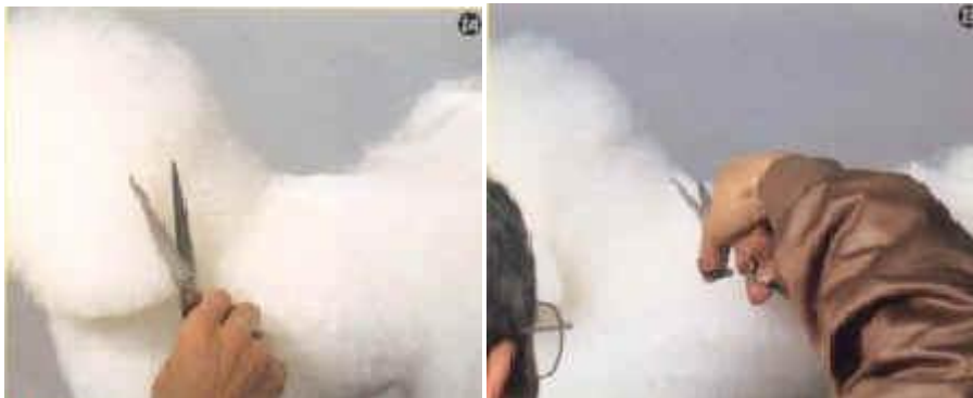
NAKKE. Løft op i ørerne, klip kort under ørerne. Ret nakken til så det passer pænt med skulderpartiet.