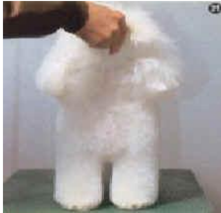
Den færdige front.