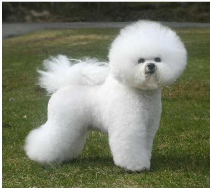
DET FÆRDIGE RESULTAT